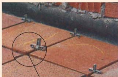
Juntas de 8 mm